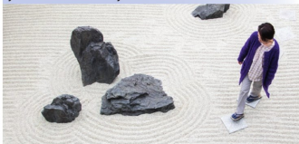
JEUDI — Le Jardin Zen