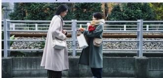
MARDI — Film surprise