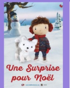
Dimanche 15/12 & 22/12