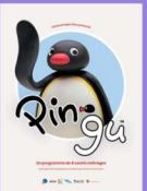
Dimanche 29/12 & 05/01