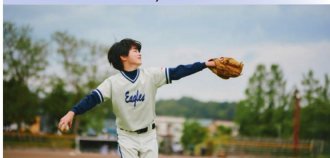
MERCREDI — My Sunshine