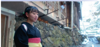
SAMEDI — En Boucle