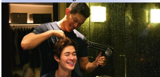
VENDREDI — Egoïst