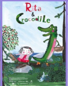
Dimanche 17/11 & 24/11