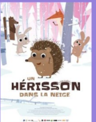
Dimanche 01/12 & 08/12