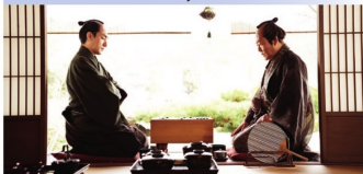
DIMANCHE — Le Joueur de Go